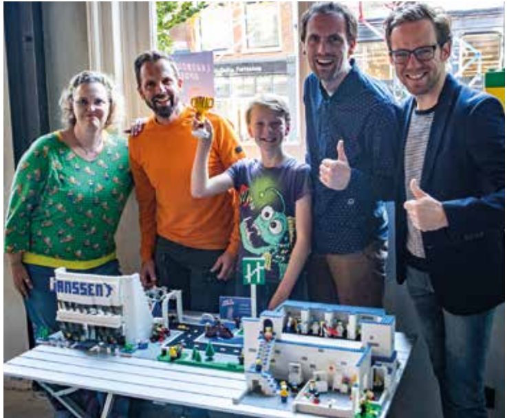
De vaccinfabriek van Janssen.