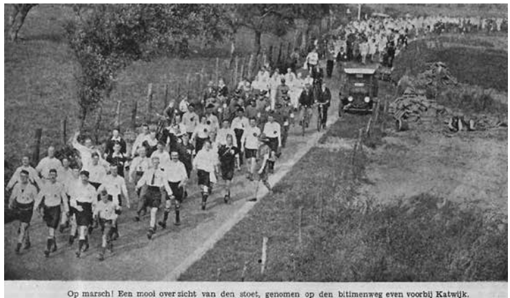
Op marsch! Een mooi overzicht van den stoet, genomen op den bitmenweg even voorbij Katwijk.

Dan wordt in Den Haag het briljante plan geboren een wandeltocht vanuit Leiden te organiseren, met vertrek- en eindpunt 'Zomerzorg' nabij het station. Zo kunnen de Leidenaren eens laagdrempelig kennismaken met de wandelsport. De tocht wordt gehouden op maandag 9 augustus 1915 en voert naar Hoek van Holland en weer terug, beslaat 70 km en dient in 12 uren afgelegd te worden om in aanmerking te komen voor een diploma.