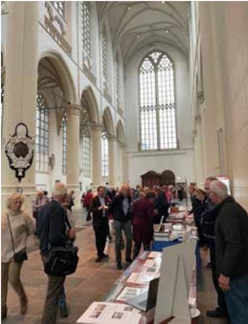
Het was meer dan ooit een reunie waarbij veel bezoekers elkaar voor het eerst sinds de corona-epidemie weer een elleboog konden geven of de hand schudden.