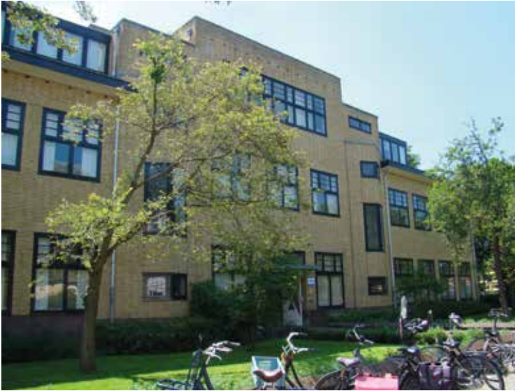
Het voormalige Joods Weeshuis aan de Roodenburgerstraat.