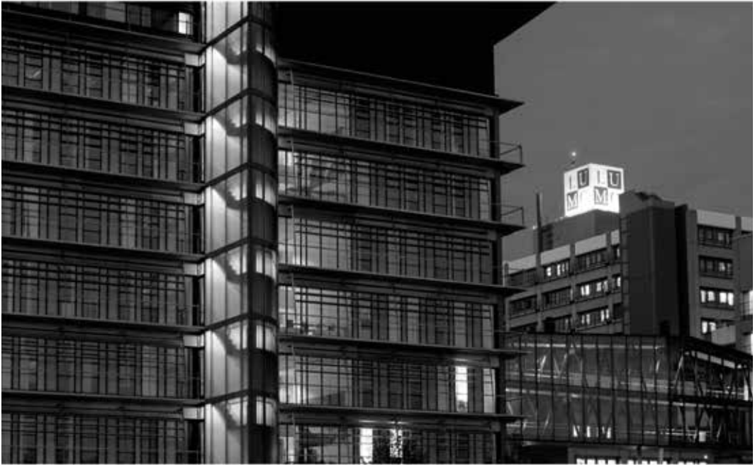
Onderzoekgebouw van de medische faculteit uit 2005 via een loopbrug verbonden met Academisch Ziekenhuis uit de jaren tachtig.

van het 'studentikoze en ballerige' en bepleitte een toegankelijke vereniging voor alle jongeren. Oud-leden richtten Quintus op en namen oude mores en leden over uit de afgedankte Augustijnse boedel. Augustinus zelf raakte de helft van haar leden kwijt. Beide verenigingen zouden volgens Slaman 'elkaar jarenlang naar het leven blijven staan'. Bij de SSR daalde het ledental van 350 naar 190. Nadat grondbeginselen waren gewijzigd weken gereformeerden uit naar Panoplia en evangelische christenen naar Ichtus. Vanaf 1976 steeg het ledental van Minerva naar 3.230 in 1987, een hoogtepunt in de historie. Gezelligheid was ook steeds meer buiten de verenigingen te vinden. Bijvoorbeeld in de bloeiende Leidse horeca met een studenten kroeg als Odessa. Voor buitenlandse studenten was er de Leiden International Students Club. Opgericht in 1959