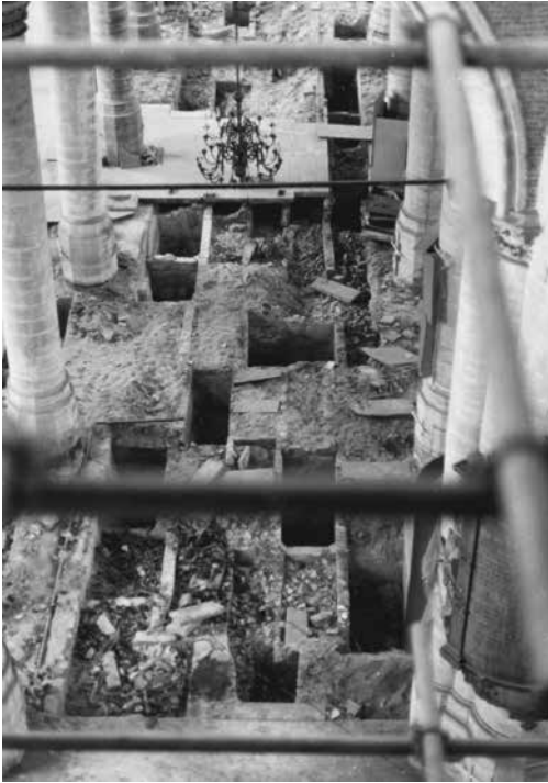
Het koor van Pieterskerk – gezien van bovenaf – met de keldergraven.