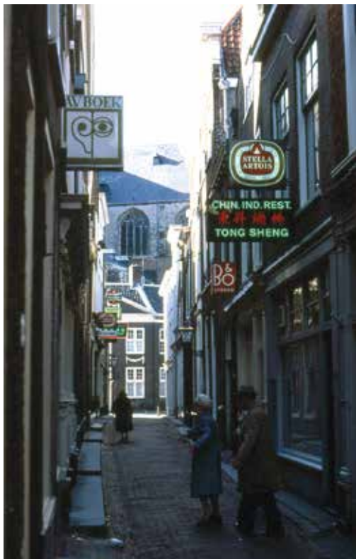
De Pieterskerk-Choorsteeg verbindt de Langebrug met het Pieterskerkhof. Aan het eind van de steeg is een deel van de Pieterskerk te zien.

Deze wandeling uit 2015 wordt als hommage aan de veel te vroeg overleden Tanneke Schoonheim herhaald. In 2013 en 2014 schreef Tanneke wekelijks een artikel over een Leidse steeg in het Leidsch Dagblad en bundelde deze artikelen in