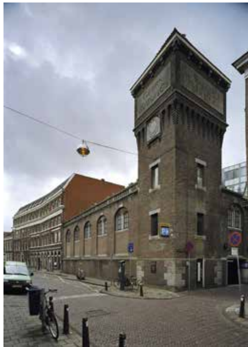
Wollendekenfabriek Van Wijk.

Binnen de stadsmuren waren ook bedrijven actief die nationale bekendheid verwierven. Zoals A.W. Sijthoff, begonnen aan de Oude Vest en later verhuisd naar de Doezastraat, die nieuwe druk- en zettechnieken ontwikkelde en een van de grootste uitgeverijen van Nederland werd. Of Meelfabriek De Sleutels aan de Zijlsingel die in 1884 werd gesticht en in de jaren vijftig van de vorige eeuw ongeveer twintig procent van de nationale meelbehoefte leverde. En Tieleman & Dros, die in 1827 als zeepziederij begon aan de Middelstegracht en Uiterstegracht en naam maakte met blikconserven die tot in Indië werden gegeten.