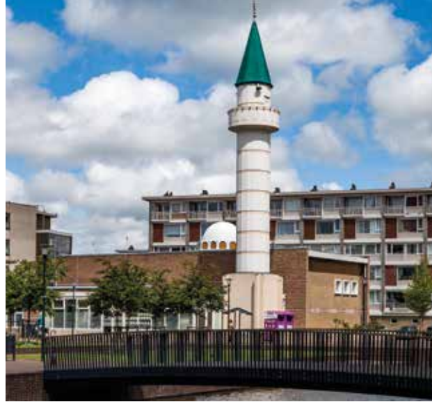
De moskee in wijk De Kooi.

In de route Van heinde en verre voert Cor Smit ons langs plekken waar nieuwkomers, migranten en