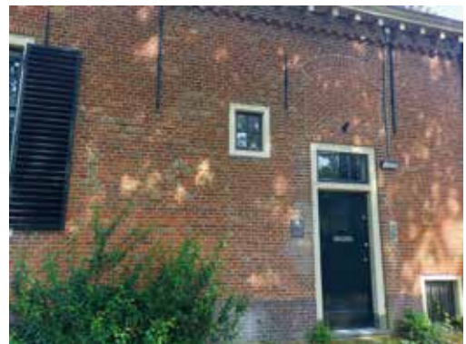
Het pesthuisje op de 5e Binnenvestgracht 7.

Met de coronapandemie op ons netvlies, is er dit jaar ook aandacht voor andere ziekten die een belangrijke rol speelden in de Leidse geschiedenis. Bezoek het Pesthuis , of het huis aan de 5e Binnenvestgracht 7 dat ooit vermeld stond als pesthuisje. In Rijksmuseum Boerhaave is de tentoonstelling 'BESMET' te zien. Dit gebouw stond vroeger bekend als pest- en dolhuis. Zondagmiddag belicht