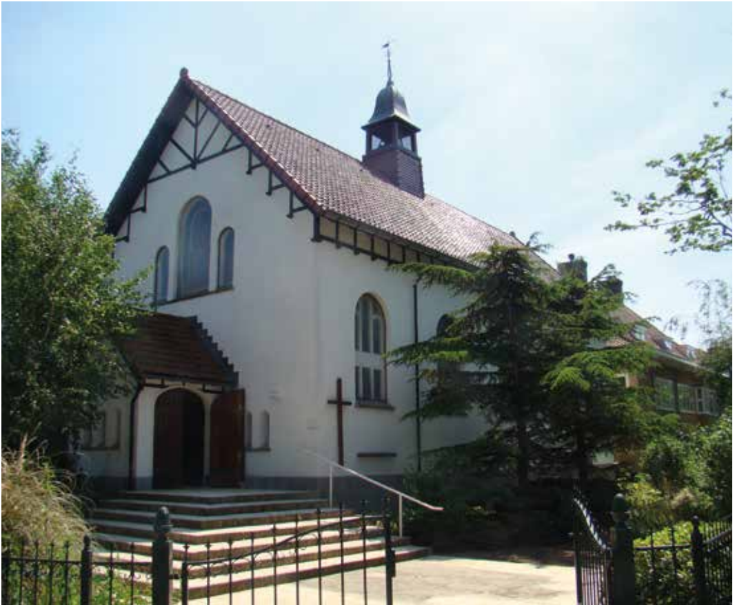
De Oud-Katholieke Kerk aan de Zoeterwoudesingel.