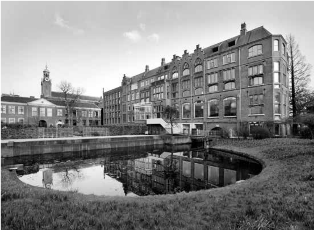
P.J. Vethgebouw in 2017 gerenoveerd voor geesteswetenschappen. Gebouwd in 1904-1906 als botanisch laboratorium en Rijksherbarium.