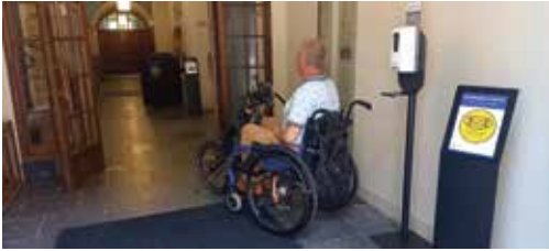
De Lutherse kerk.

mocht niet zichtbaar zijn vanaf de openbare weg ( Lutherse kerk en Lokhorstkerk ).