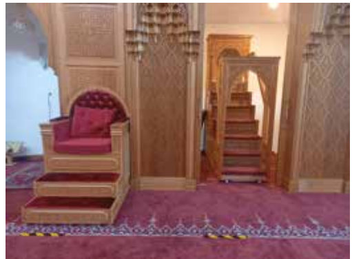
De minbar in de Al Hijra Moskee.

passanten zich vestigden en hun eigen plekje binnen de Leidse samenleving vonden. Van Lutheranen uit Duitsland, de Walen en de Engelsen tot de Turkse arbeidsmigranten die in begin van de jaren '70 van de vorige eeuw een thuis vonden, bouwden hier huizen, winkels en plekken van samenkomst en gebed ( Moskee Mimar Sinan en Al Hijra Moskee ). Dat de nieuwe gemeenschappen dan ook graag hun eigen geloof wilden belijden werd oogluikend toegestaan, zolang het maar niet in het openbaar was. Het kerkgebouw (schuilkerk)