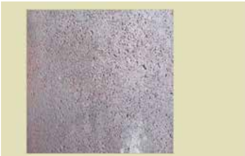
Detailopname van het vulkanisch uitvloeiinggesteente op de achterzijde van een geëmailleerd straatnaambord. Foto Jerry Driesen, 2011.

toegepaste decoratieve emailleertechniek bij ingangen van de Parijse metro en wordt beschouwd als de belangrijkste architect van de Franse Art Nouveau-beweging.