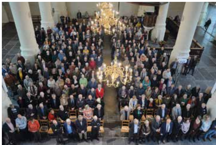
Een impressie van de diesviering 2019.

* Bovenstaande is afhankelijk van de dan geldende coronamaatregelen. Op de HVOL-site en in nieuwsbrieven is de meest actuele informatie terug te vinden.