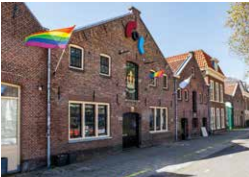
Langegracht met De Kroon

We stuiten ook op het besef dat de verhoudingen niet altijd egalitair waren en dat de Nederlandse handelsgeest in haar vroegere koloniale gebiedsdelen op een eenzijdige manier de grondstoffen gebruikte en de plaatselijke bevolking uitbuitte. Een aantal van de statige grachtenpanden is gebouwd met fortuin dat is vergaard in die periode. De maatschappelijke discussie hierover is actueel. Loop dit jaar de Regenboogwandeling, uitgezet door COC Leiden ( De Kroon ) en ontdek plekken in Leiden die een rol hebben gespeeld in de emancipatie van de homo's, lesbiennes en de LHBTIQ+-gemeenschap.