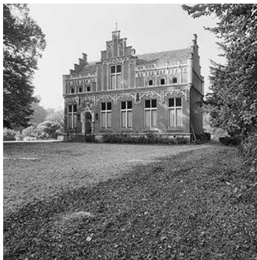
Jachtslot Ter Horst. Oktober 1985

In 1903 koopt Koningin Wilhelmina De Horsten van dochter Marie van prins Frederik en zo komt het landgoed via achtereenvolgens Juliana en Beatrix bij Willem Alexander terecht.