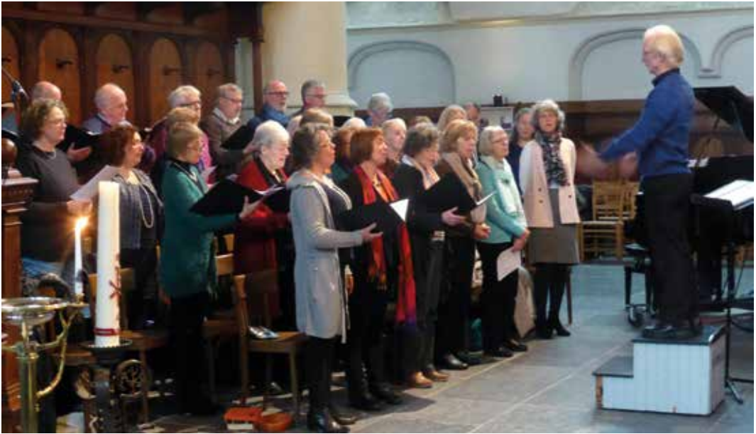
De Schola luistert een doopdienst op in januari 2016.

Van recenter datum zijn initiatieven, contacten en samenwerking dichterbij huis. Zoals de Taalgroep om vluchtelingen Nederlands te leren, bijlessen in Leiden-Noord, steun aan onder meer STUV (uitgeprocedeerde asielzoekers), hospice Issoria, het Straatpastoraat (daklozen), Exodus (ex-gedetineerden) en de Voedselbank. Voor de leden zijn er studiereizen naar onder meer Hongarije, de DDR, Polen en Rome. Maar er is ook ruimte voor ontspanning en gezelligheid. In 2018 ziet het er even naar uit dat de Ekklesia over een eigen kerk kan beschikken. Maar de Lutherse kerkenraad ziet uiteindelijk af van verkoop of verhuur van de kerk aan de Hooglandse Kerkgraacht.