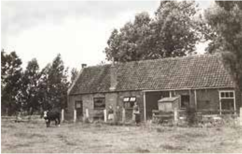
Voorschoten. De stal achter woning aan de Rijndijk 101 die in 1947 werd ingericht tot kerkzaal voor de protestanten.

stal achter de woning aan Rijndijk 101. Na acties van leden wordt in 1963 aan Rijndijk 123 een houten prefab constructie officieel als kerk in gebruik genomen.