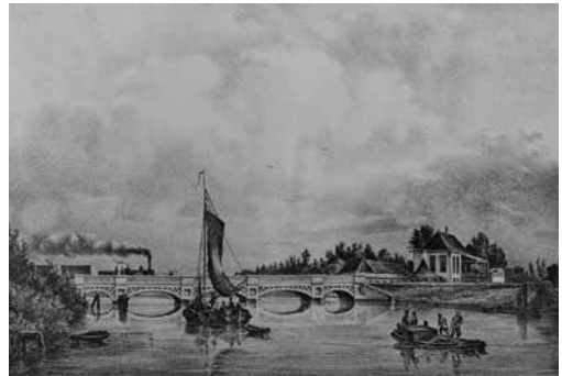
De eikenhouten spoorbrug over de Rijn uit 1842, ontworpen door waterstaatsingenieur F.W. Conrad, met vier vaste dekken en een beweegbare om schepen te laten passeren. De tekening werd in 1847 gemaakt door P.J. Lutgers.

Jan Sloof verzamelt voor zijn boek een schat aan gegevens uit archieven en via interviews. Het levert een boeiend beeld op van bewoners, middenstanders, fabrikanten, boeren en tuinders van het voormalige ‘Voorschoten aan den Rijn’.