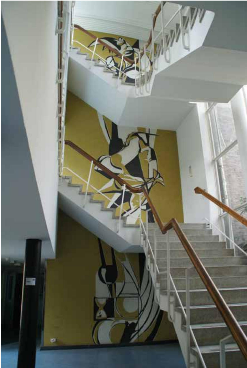
De sgraffito's van Lex Horn: locatie voor herplaatsing gezocht.