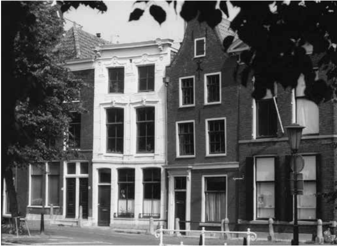
Ontmoetingscentrum Rapenburg 100 met witte voorgevel. Grenzend aan de studentenparochie op huisnummer 102 met tuitgevel.