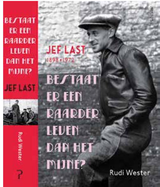
De biografie over Jef Last door Rudi Wester vormt de basis van de lezing.

Rudi Wester schreef een biografie over deze letterkundige vechtjas en spreekt op 2 mei over zijn verblijf in Leiden en Katwijk, en de invloed van deze periode op zijn verdere leven. Westers boek, getiteld Bestaat er een raarder leven dan het mijne? , vormt de basis van de lezing en is verkrijgbaar bij de betere boekhandel. De lezing begint om 14.30 uur en vindt plaats in de Lokhorstkerk. Het is op dit moment (tweede helft januari) niet duidelijk of de op 2 mei geldende maatregelen in verband met de coronapandemie een lezing met publiek toestaan en zo ja, of het publiek aan een maximum zal zijn gebonden. Als er geen publiek aanwezig kan zijn,