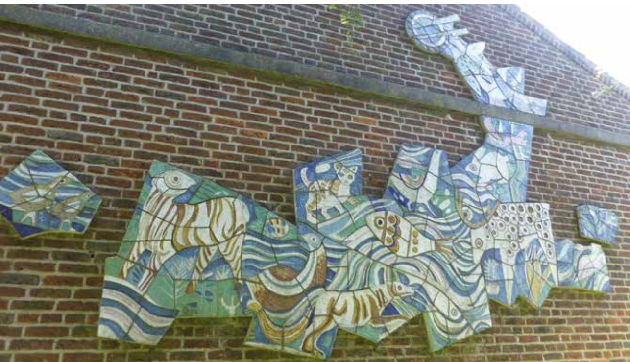
Keramisch gevelplastiek van J.B. Lambert Simon, Lammenschansweg.

een belangrijk voorbeeld van het werk van een (voor Leiden) belangrijke kunstenaar, een bepaalde stijl of kunststroming? Hoe groot is het belang van het werk voor de lokale cultuurhistorie? Hoe sterk is de architectuurhistorische context van het kunstwerk? Natuurlijk speelt ook de gaafheid van het kunstwerk een rol. Als een kunstwerk op de meeste criteria hoog scoort, leidt dat tot een pleidooi voor behoud. Wat bij het behoud niet verloren mag gaan, is het verhaal dat bij het kunstwerk hoort. Zo is de uitleg bij de gelukkig wel herplaatste betonreliëfs van Lex Horn uit de voorgevel van het Clusiuslaboratorium aan de Wassenaarseweg belangrijk voor een goed begrip van het kunstwerk.