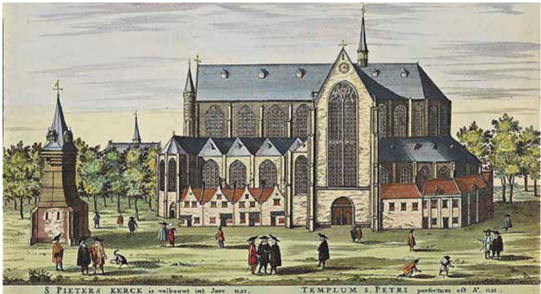
Pieterskerk van Leiden uit het Stedenboek van Frederick de Wit (1698).

De lezing is uitsluitend online te volgen via Zoom. Uw aanmelding voor de ALV geeft u tevens toegang tot de lezing. De aanmeldingsprocedure voor ALV en lezing vindt u elders in dit blad of op onze site: www.oudleiden.nl .