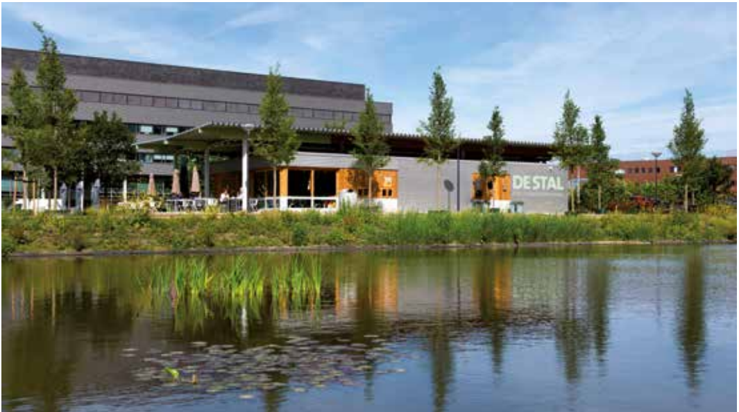
Ontmoetingscentrum De Stal (foto: Marc de Haan).

de Amsterdamse beurs, de AEX. In 2007 noteren de aandelen nog 7 euro. In 2020 jojoet de koers – mede als gevolg van de coronacrisis. Op 20 februari tikt de notering de 253 euro aan en op 17 december is daar nog 75 euro van over. Inmiddels is er met ruim 85 euro sprake van herstel en zijn er plannen voor nieuwbouw.