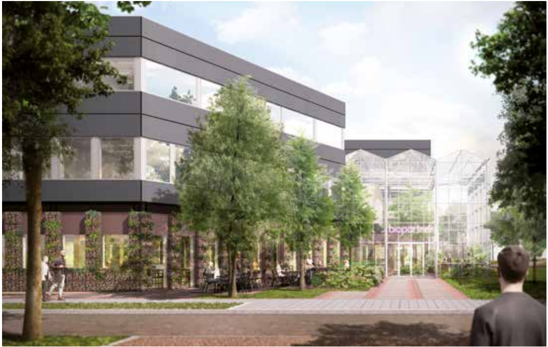
Artistieke impressie van het gebouw Biopartner 5, ontworpen door Jan Wilem ter Steege en Josse Popma.

de startmotor van het Bio Science Park. De primeur komt het Amerikaanse bedrijf Promega Biotec toe. Met een kantoor en lab in het Gorlaeus-gebouw van de universiteit is de eerste combinatie van wetenschap en bedrijfsleven een feit. Maar biotechnologisch pioniersbedrijf Centocor kan bogen op de primeur van een eigen gebouw op het park. Het bedrijf legt zich eerst toe op diagnostiek, maar later ook op de ontwikkeling en productie van medicijnen. Een middel tegen bacteriële infectie flopt in de VS en er vallen in Leiden 137 ontslagen. Herstel volgt snel als geneesmiddelen tegen hart- en vaatziekten en de ziekte van Crohn zeer succesvol blijken. In 2000 telt Centocor 650 medewerkers en koopt farma-reus Johnson & Johnson de aandelen. J&J besluit in 2010 alle farmaceutische bedrijven te verenigen onder de naam Janssen