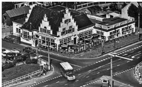
Een luchtfoto van hotel-restaurant Het Haagsche Schouw aan de autoweg Den Haag-Amsterdam, gemaakt door KLM Aerocarto omstreeks 1965.