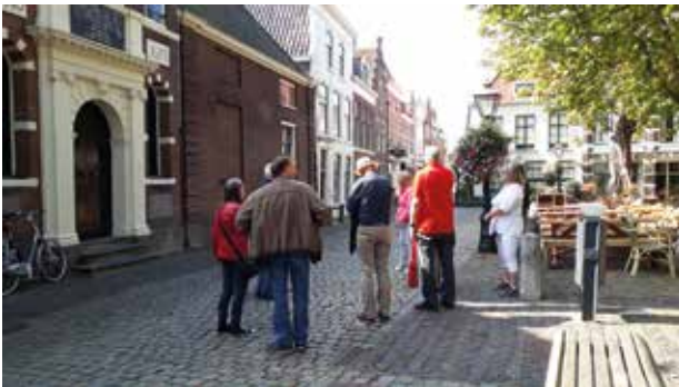
Pilgrimwandeling door Leiden.

aan te koppelen. Of aan museumbezoeken, bestaande uit een lezing plus een rondleiding over een mooie tentoonstelling of langs relevante objecten uit de collectie van het museum. Ook combinaties met muziek kunnen interessant zijn. De ontwikkeling van een programma in samenhang met lezingen en andere evenementen, wordt voortgezet. Op dit moment ziet het er in verband met de coronapandemie nog niet naar uit dat er op korte termijn veel mogelijkheden zijn, maar dat geeft de commissie tijd voor het maken van een programma.