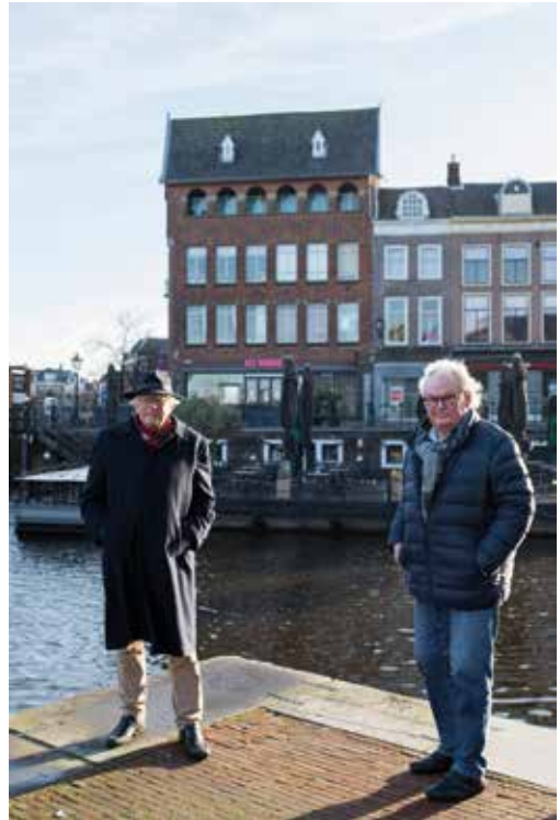
Zeven jaar verzet tegen uitbreiding van het terras van Annie's werd onlangs beëindigd met een compromis.

Hebben jullie het gevoel dat Oud Leiden serieus wordt genomen door het gemeentebestuur? Wordt er voldoende naar jullie geluisterd?