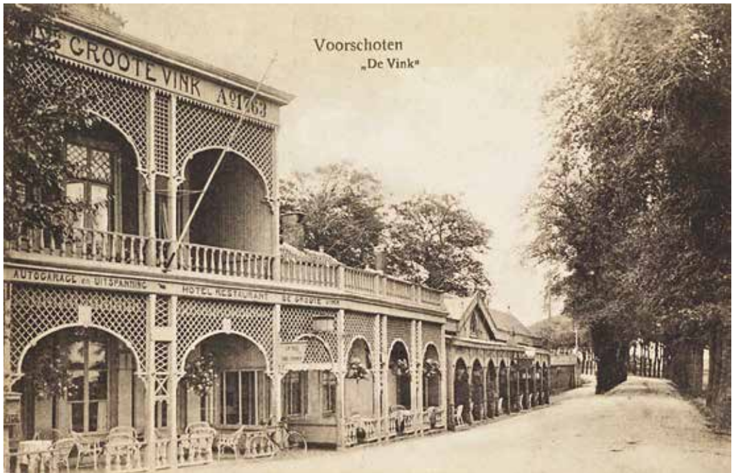
Uitspanning De Groote Vink Anno 1763 met ernaast concurrent De Kleine Vink. De prentbriefkaart schetst de situatie rond 1900.