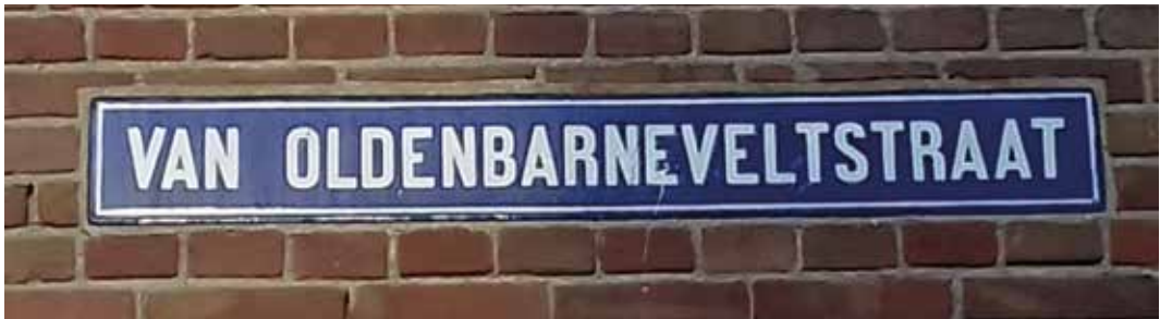
In de Raadsherenbuurt zijn nog diverse lavastenen straatnaamborden te vinden.

lijk van alles, zoals tegenwoordig een tuincentrum doet. Of zij steen leverde voor de Leidse straatnamenbordjes, valt te betwijfelen. Een ander adres was Bloemkweekerij Flora, Maredijk 61, ook zo'n soort tuincentrum. Ongetwijfeld zijn er nog (vele) meer, als je daar studie van zou maken.