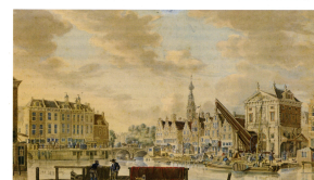
Geslacht op de Haagman, met de Vahng over de Nieuwe Rijn. Geslacht van de Sille. Rijn (y) de Sille. Man. Rechts de Kalmak met de Hout en het Houtgebou met boks. Links een geslacht van Fluut en Lucht en de Hout. Geslacht op de achtergrond de Stadhuisman. Tekening Jan de Beijer 1753. E.L.C. P44739.2