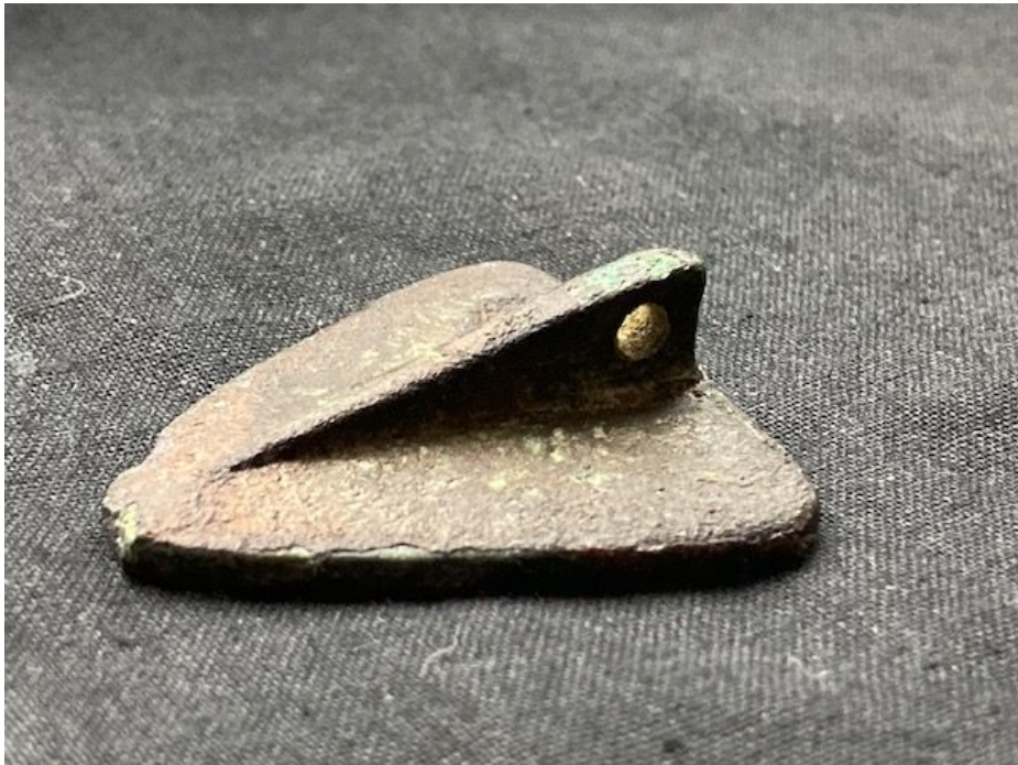
Een afbeelding uit de Beeldbank De Haarlemmerstraat in 1904