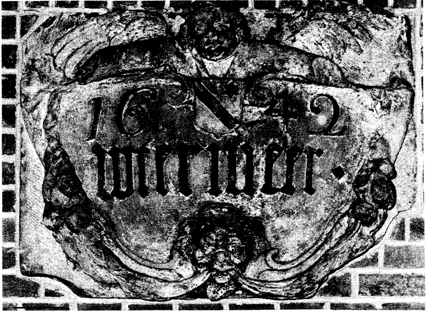
Afb. 1. De gevelsteen van Uitermeer

een fraaie bungalow verbouwde koetshuis van Klein Leeuwenhorst. In een soort waranda meende hij daar een dergelijke steen gezien te hebben. Het bleek geheel juist te zijn! Onder een afdak aan de achterzijde van het huis bevond zich de langgezochte steen: „Wtermeer 1642”. Er was iets